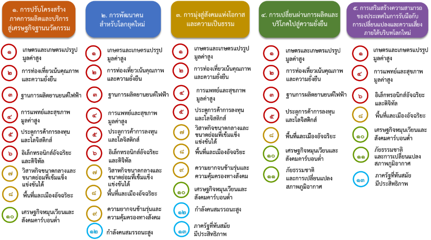
แผนภาพ ความเชื่อมโยงระหว่างหมุดหมายการพัฒนา กับเป้าหมายหลัก